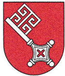
Bremen 419 km 2 0,657 Mio EW