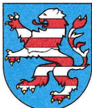
Hessen 21.115 km 2 6,045 Mio EW