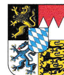
Bayern 70.550 km 2 12,604 Mio EW