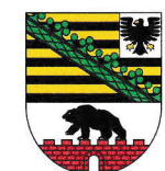
Sachsen-Anhalt 20.450 km 2 2,244 Mio EW