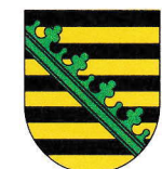
Sachsen 18.420 km 2 4,046 Mio EW