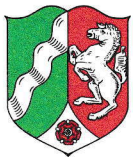
Nordrhein-Westfalen 34.092 km 2 17,571 Mio EW