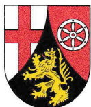
Rheinland-Pfalz 19.854 km 2 3,994 Mio EW