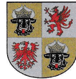
Mecklenburg-Vorpommern 23.191 km 2 1,596 Mio EW