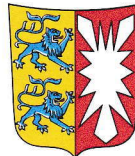
Schleswig-Holstein 15.799 km 2 2,815 Mio EW