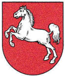
Niedersachsen 47.613 km 2 7,790 Mio EW