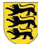
Baden-Württemberg 35.751 km 2 10,631 Mio EW