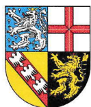
Saarland 2.569 km 2 0,990 Mio EW