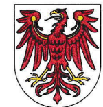
Brandenburg 29.483 km 2 2,449 Mio EW