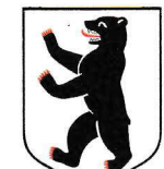
Berlin 888 km 2 3,421 Mio EW